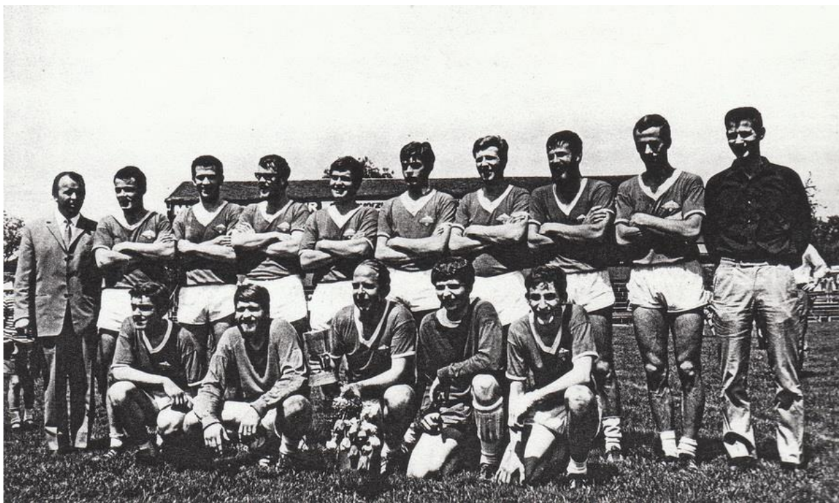
Mannschaftsaufstellung des TV Suhr (Cupsieger 1968/69)